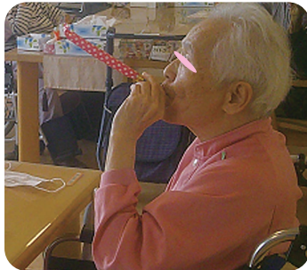
ピロピロを使って思い切り空気を吐き出す。

2階新棟では10月19日(土)に口腔行事を行いました。歯科衛生士監修のもと、息を吸う吐くなどの口腔機能向上を兼ねた取り組みを、遊び心を交えて企画し行いました。