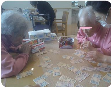
息を吸いお札を吸い上げて、自分のカゴに入れる。