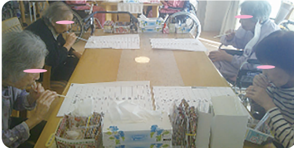
ストローで息を吹いて重りを遠くまで飛ばす。