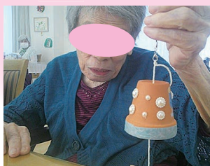
キーホルダーづくり