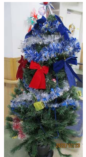
みぬま内を彩ったクリスマスの風景