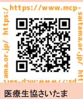
医療生協さいたま