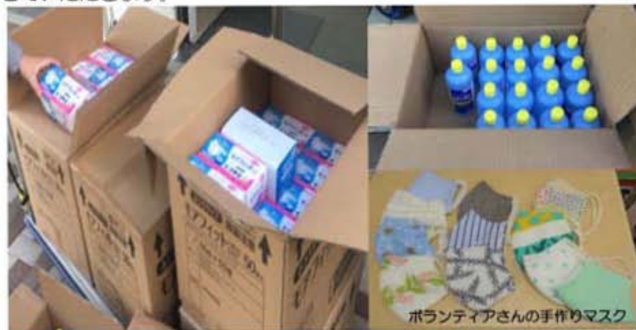
ボランティアさんの手作りマスク

川口市からマスクと消毒液をいただきました。また組合員ボランティアより手作りマスクが届きました。感染拡大防止のために大切に使用させていただきます。