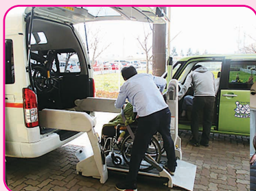
車に乗って、さあ出発!!